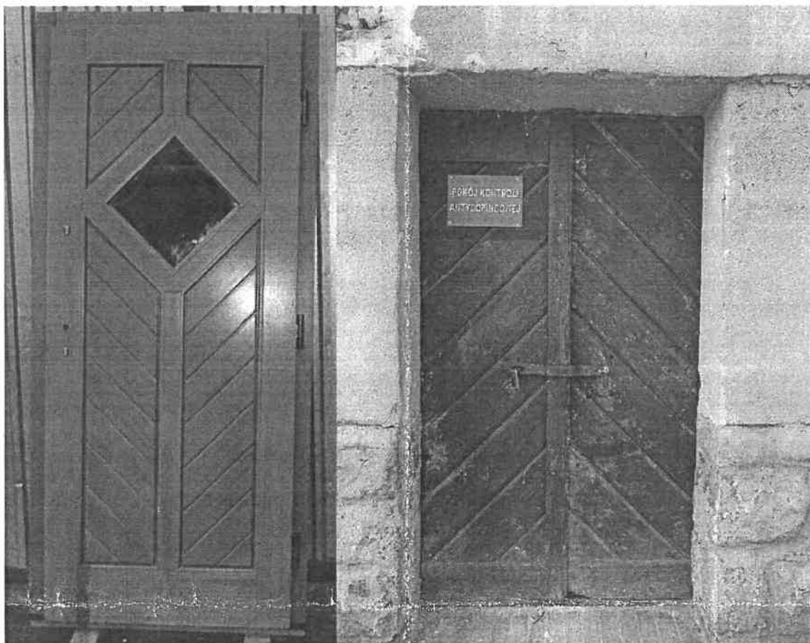
Przykłady drzwi klepkowych